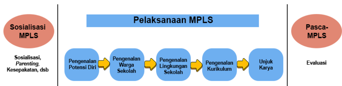
Gambar 1.1 Alur Kegiatan MPLS Ramah

Gambar 1.1 menjelaskan bahwa MPLS Ramah dilakukan dalam tiga tahapan yang merujuk pada Peraturan Menteri Pendidikan Dasar dan Menengah Nomor 12 Tahun 2026 tentang Masa Pengenalan Lingkungan Sekolah, yaitu perencanaan, pelaksanaan, dan pascapelaksanaan.